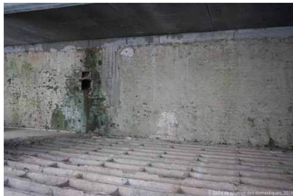
Salle de réunion des domestiques, 2018