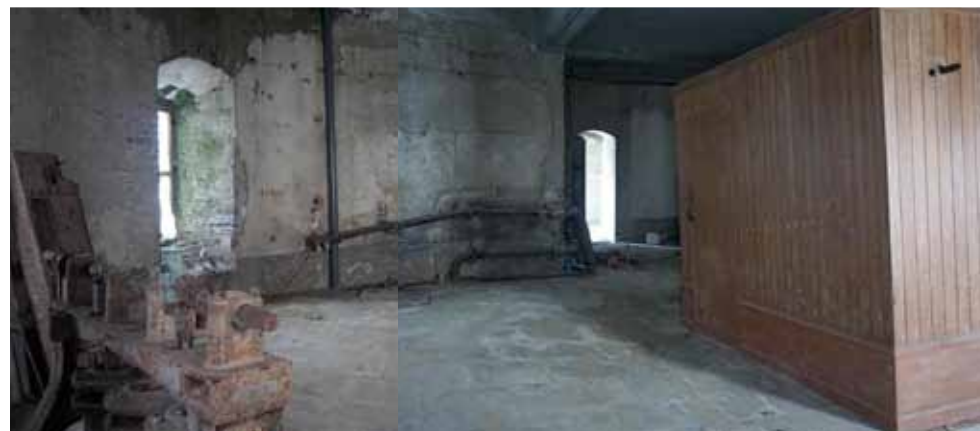
Salle des fermiers ou réserve du jardinier, 2018