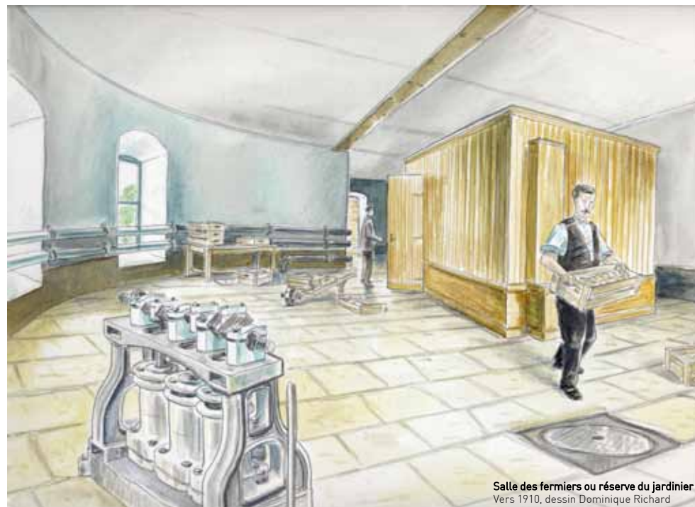
Salle des fermiers ou réserve du jardinier Vers 1910, dessin Dominique Richard

This was also the entry point for electricity produced in the electric station in the stable-block