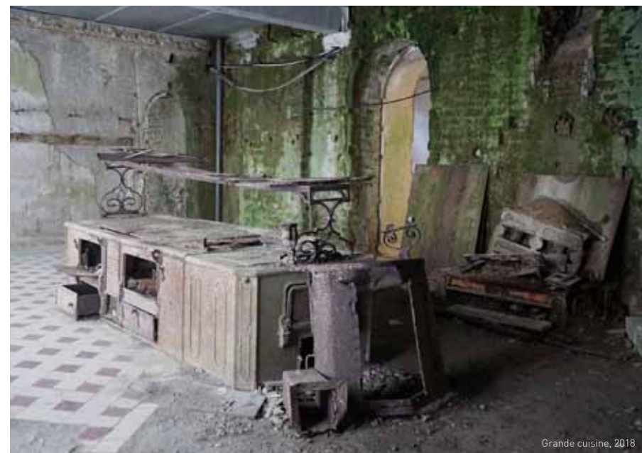
Grande cuisine, 2018