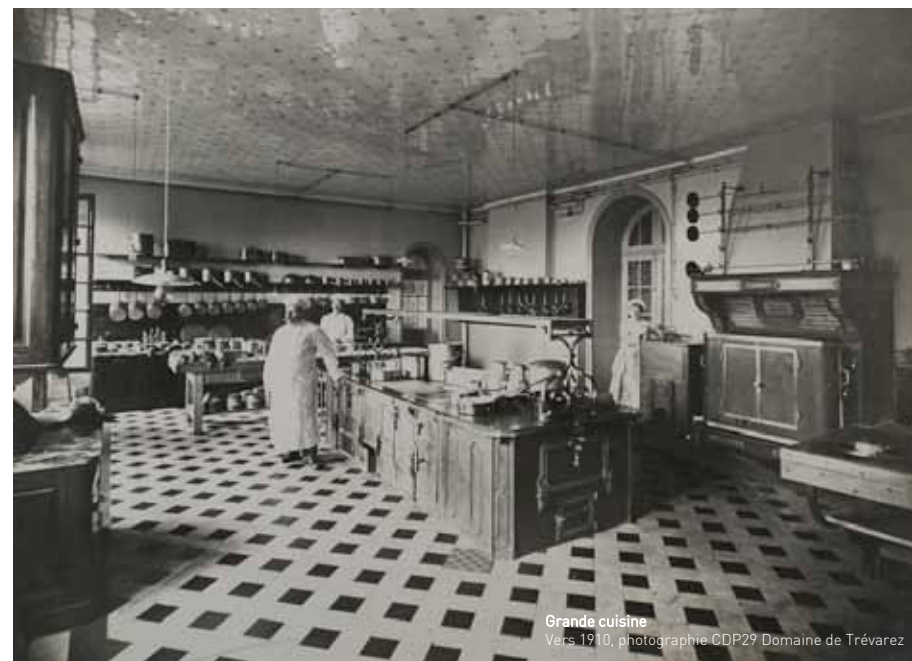
Grande cuisine Vers 1910, photographie CDP29 Domaine de Trévarez

The head chef, aided by two commis chefs, practised his art at the great central cooking station. It was coal-powered, because the culinary tradition dictated that cooking on this type of cast-iron "piano" with copper saucepans was infinitely superior to that of gas or electric cookers.