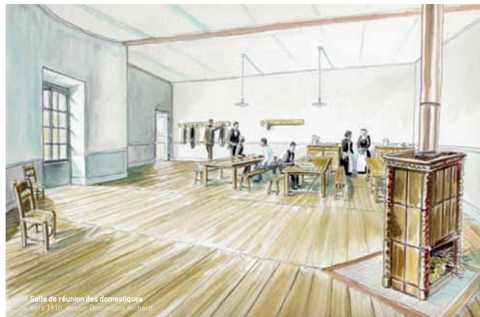
Salle de réunion des domestiques Vers 1910, dessin Dominique Richard

There was a telephone nearby in a small room with wooden and fabric covered walls. Its original purpose was most likely for communicating with the stables.