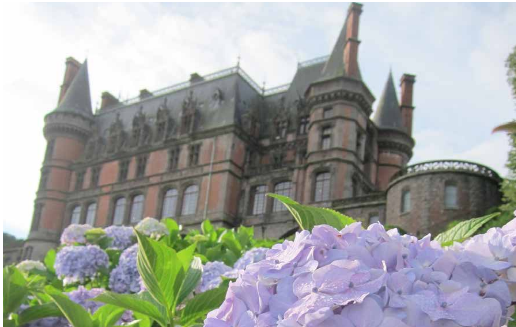
➤ Sous le château